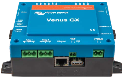
Venus GX ön ağı