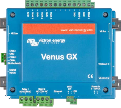
Konektörlü Venus GX